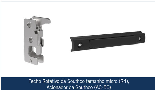
Fecho Rotativo da Southco tamanho micro (R4), Acionador da Southco (AC-50)

Como a Dog&Drive precisava de um material leve, a melhor solução foi optar pela fibra de carbono. Embora fosse a melhor opção pelo lado funcional, isto significava que muitas soluções mecânicas precisavam ser desconsideradas. No entanto, o Fecho Rotativo tamanho micro (R4) da Southco, com seu design compacto, poderia ser alojado dentro da estrutura de fibra de carbono. Como o cabo Bowden tem um diâmetro estreito e é flexível, as peças puderam ser introduzidas através do material de carbono nos pontos exatos, assegurando uma aparência clean, sem costuras e com um ótimo acabamento.