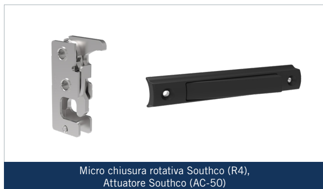
Micro chiusura rotativa Southco (R4), Attuatore Southco (AC-50)

La soluzione di chiusura prevista da Southco fornisce un sistema preciso che consente all'operatore di muoversi da entrambi i lati del veicolo, ottenendo lo stesso risultato finale, indipendentemente dalla maniglia utilizzata per spostare la scala dalla posizione "chiusa". L'attuatore scelto (AC-50) consente un funzionamento intuitivo, in quanto l'impugnatura ergonomica è integrata all'interno del gradino. Il che significa che l'utente può afferrare la parte superiore del gradino e, allo stesso tempo, azionare la maniglia con il massimo controllo.