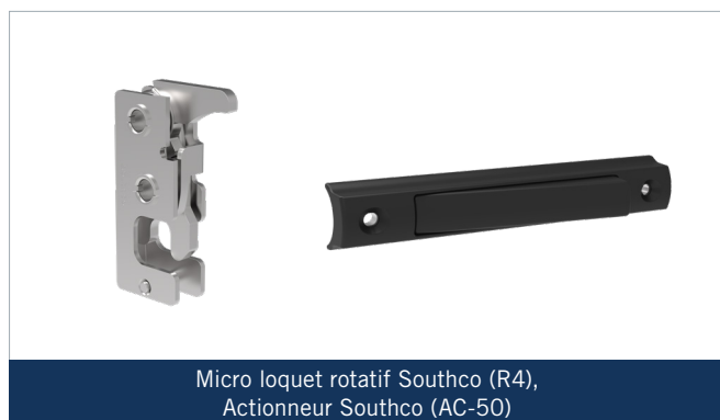
Micro loquet rotatif Southco (R4), Actionneur Southco (AC-50)

La solution de verrouillage prévue par Southco fournit un système précis qui permet à l'opérateur de se placer d'un côté ou de l'autre du véhicule sans altérer la fonctionnalité et obtenir le même résultat final, quel que soit le type de véhicule et quelle que soit la poignée utilisée pour déplacer l'escalier depuis sa position fermée. L'actionneur choisi (AC-50) permet un fonctionnement intuitif, car la poignée ergonomique est intégrée à la marche. L'utilisateur peut donc saisir le haut de la marche et, en même temps, actionner la poignée avec un contrôle total.