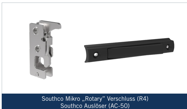
Southco Mikro „Rotary“ Verschluss (R4) Southco Auslöser (AC-50)

Die von Southco angebotene Lösung bietet ein präzises System, das es dem Benutzer ermöglicht, das Verriegelungssystem von beiden Seiten des Fahrzeugs aus zu bedienen, unabhängig davon, welcher Griff verwendet wird, um die Treppe aus der geschlossenen Position zu lösen. Der gewählte Auslöser (AC-50) ermöglicht eine intuitive Bedienung, da der ergonomische Griff in die Klapptreppe integriert ist.